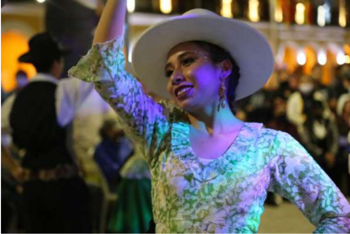
CCP Tunante en Cochabamba.