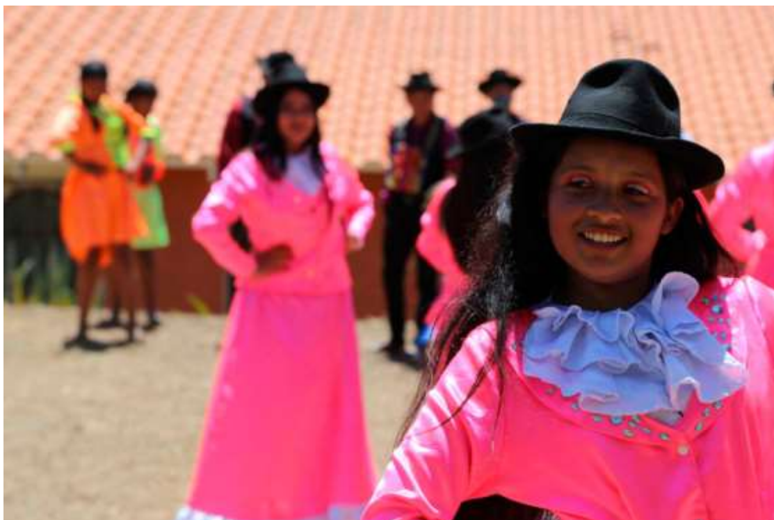
CCP Tunante en Vallegrande.

En el transcurso de un año el CCP ha recorrido barrios como Vallecito II y el Distrito 12, municipios como los de Vallegrande, Buena Vista, La Guardia, Pucara y ciudades capitales como Cochabamba y Tarija. Estos recorridos que aún marcan el inicio de un proyecto a largo plazo, han generado enriquecedoras experiencias para el CCP. Entre las cuales podemos destacar el hecho de haber logrado entrar en contacto con una gran cantidad de artistas emergentes de distintas disciplinas, además de compartir y aprender de diversos modelos de gestión cultural que se llevan a cabo a lo largo del territorio nacional.